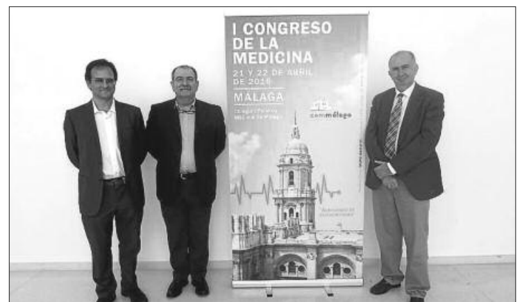
Los organizadores del Congreso.